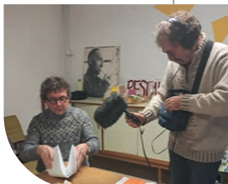
Projet Les Métiers Contés