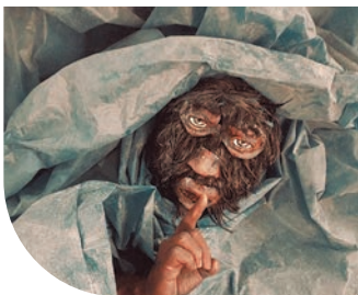
Histoires Invisibles, par la Cie Graine de Vie, en résidence en août 2025