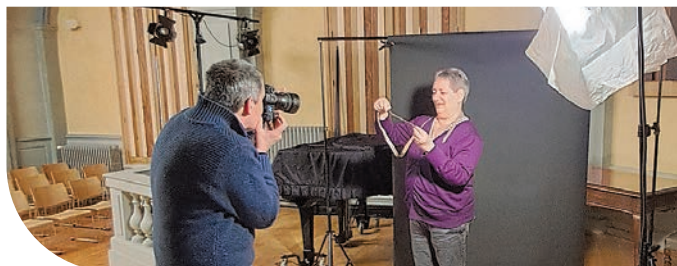
Projet Les Métiers Contés sur Poligny, Arbois et Salins-les-Bains pour réaliser une photographie mémorielle et humaine d'un territoire rural et de ses habitants