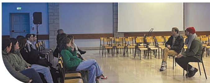
École du Spectateur avec les élèves du collège Grévy de Poligny avant le spectacle L'Abolition des Privilèges avec la Cie Le Royal Velours