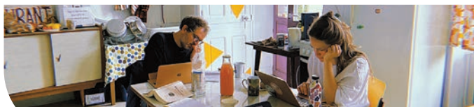
La Cie Brutaflore est déjà venue en résidence en juin 2025 pour leur nouvelle création Orlando Furioso, ou l'Art de la Fugue .

Représentation publique : mardi 9 décembre 2025 à 20 h 30 à La Chapelle de La Congrégation, à partir de 10 ans (voir page 13).