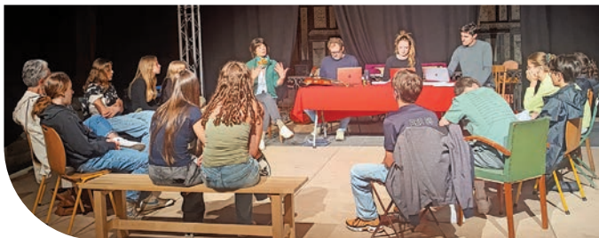
Sortie de résidence scolaire de la Cie Brutaflore pour la création Orlando Furioso, ou l'Art de la Fugue , en résidence en juin 2025

Ce temps est très important pour eux puisqu'il leur permet de se mettre en conditions réelles de représentation et de nourrir leur création. C'est pourquoi Mi-Scène vous invite et vous encourage à venir à chaque sortie de résidence.