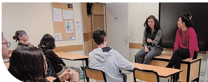
École du Spectateur à l'ENILEA de Poligny avant le spectacle Liberté avec le Théâtre de l'Incendie