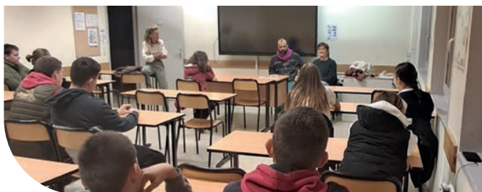
École du Spectateur à l'ENILEA de Poligny avant le spectacle La Petite Galerie du Déclin avec la Cie Portés Disparus

Mi-Scène s'adresse aux établissements scolaires ou aux groupes extrascolaires qui viennent assister aux spectacles programmés pour proposer un temps d'échange entre les artistes et les jeunes spectateurs. Ce moment permet d'aller plus loin dans l'expérience du théâtre vivant par l'acquisition de clefs de compréhension nécessaires à une meilleure lecture du spectacle et par l'affirmation de son point de vue critique. Au-delà du cours magistral, ce temps est dédié à l'échange et à la discussion.