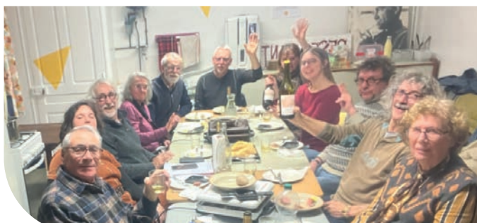
Repas annuel des bénévoles pour fêter la nouvelle année